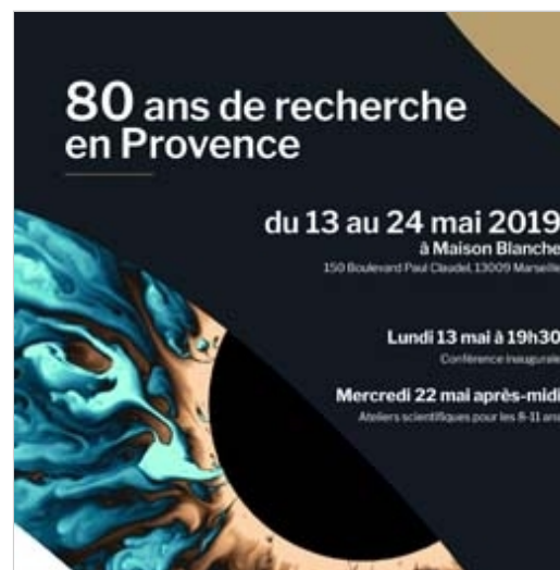
Exposition "80 ans de recherche en Provence" et conférence